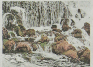
Cascade de Bellegarde.