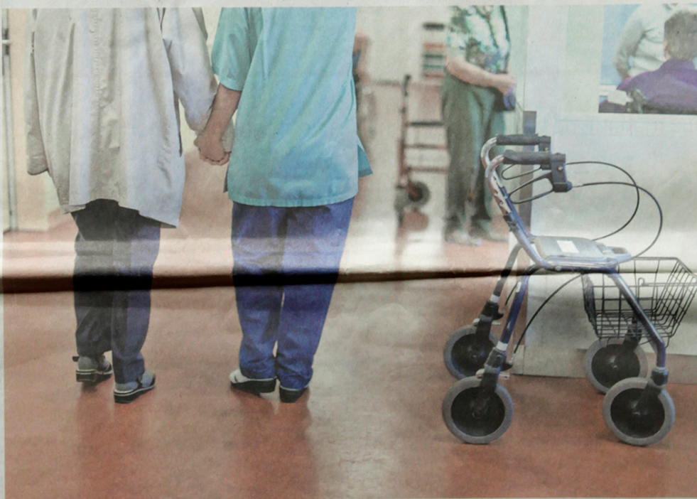
Les déambulateurs font partie du matériel de soins que les assureurs-maladie ne sont plus tenus de rembourser.

PANSEMENTS Les assureurs ne sont pas tenus de rembourser pansements, couches pour l'incontinence, attelles, déambulateurs et autres matériels utilisés couramment dans les EMS ou lors des soins à domicile. Cet été, des établissements du canton de Fribourg ont ainsi reçu une facture salée car les caisses leur demandent de rembourser les sommes payées depuis 2015. La justice est du côté des assureurs, le Tribunal administratif fédéral ayant émis un arrêt à ce propos. Cette situation plonge les prestataires de soins dans une grande incertitude, qui va jusqu'à freiner les sorties à l'HFR. >> 9